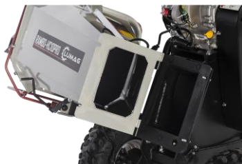
Klappbarer Ein- & Auswurftrichter